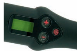
Termostato Display digitale a colori Per impostare la temperatura desiderata e verificarne comodamente il raggiungimento con il variare dei colori.