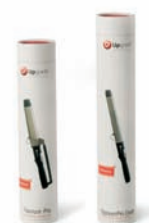
Packaging esclusivo Il design Upgrade è unico ed esclusivo anche sullo scaffale, grazie al packaging e agli espositori.